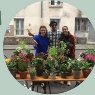
Ventes à prix libre