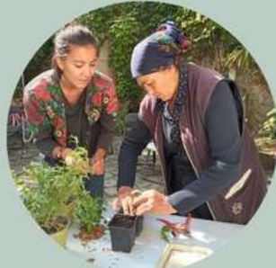
Ateliers dans des structures sociales